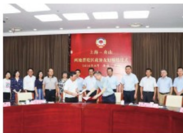
与浙江省舟山市普陀区政协 签订合作框架协议