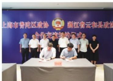
与浙江省丽水市云和县政协 签订合作交流活动