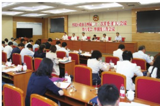
区政协十四届二十一次常委会议