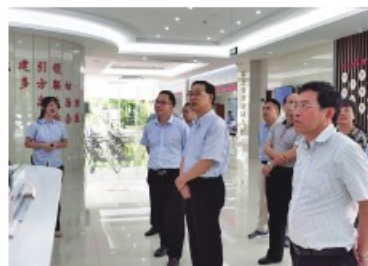
考察团学习考察舟山市 “信访超市”