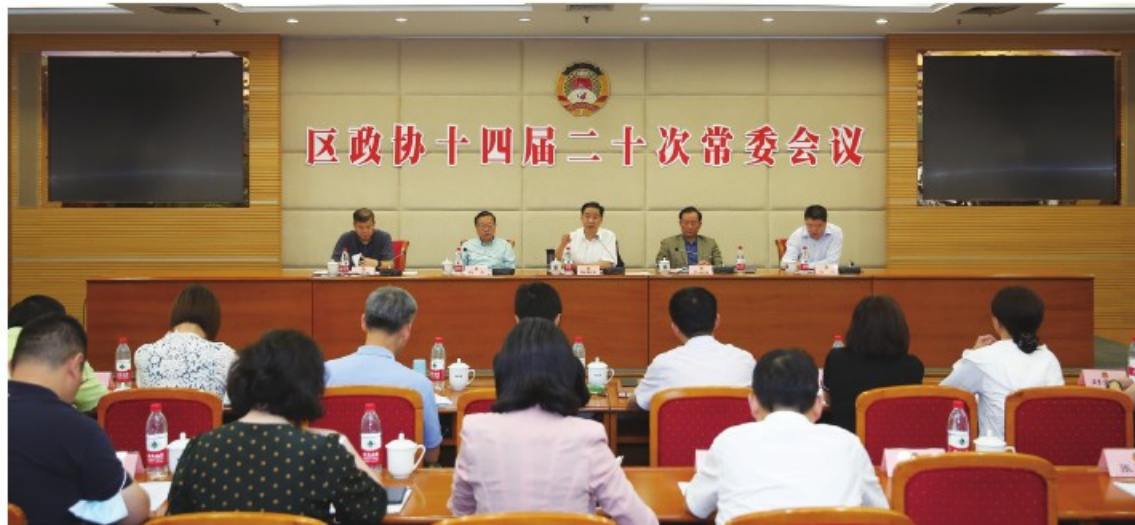
区政协十四届二十次常委会议