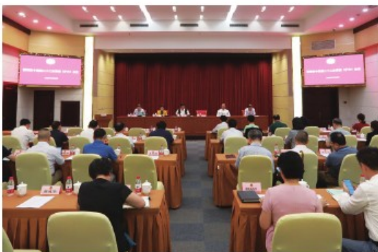
区政协十四届二十二次常委会议